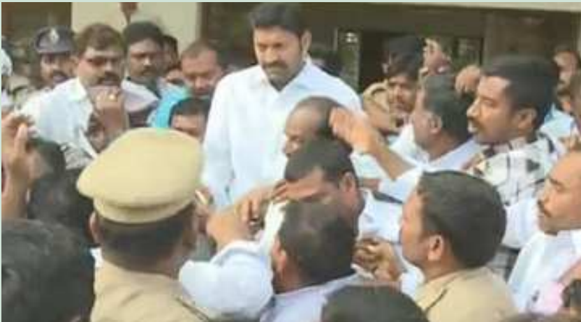
ఎంపీ వైయస్ అవినాష్ రెడ్డిని ఇంటిని ముట్టడించి ఆయన్ను బయటకు రాకుండా అడ్డుకుంటున్న పోలీసులు

పైడిపాలెం రిజర్వాయర్ ప్రారంభోత్సవంతో దివంగత ముఖ్యమంత్రి వైయస్ రాజశేఖరరెడ్డి కల సాకారం అయిందని కడప ఎంపీ వైయస్ అవినాష్ రెడ్డి అన్నారు. పైడిపాలెంలో జరిగిన జన్మభూమి కార్యక్రమంలో ఆయన పాల్గొన్నారు. వైయస్ఆర్ హయాంలోనే ప్రాజెక్టులకు రూపకల్పన జరిగిందని, ఆయన హయాంలోనే 90 శాతం పనులు పూర్తయ్యాయని చెప్పారు. పైడిపాలెం నిర్మాణానికి పరిహారం చెల్లించాలని ముఖ్యమంత్రి చంద్రబాబును కోరారు. అలాగే ఎస్సీ ఎస్టీ కాలనీలలో కరెంటు బిల్లులు చెల్లించడంలో జాప్యం జరుగుతోందని, వెంటనే ఎస్సీ ఎస్టీ సబ్ ప్లాన్ నిధుల ద్వారా వారి కరెంటు బిల్లులు చెల్లించి, ఆయా కాలనీలకు విద్యుత్ సదుపాయం కల్పించాలని కోరారు. 2012-2013వ సంవత్సరంలో దెబ్బతిన్న శనగ పంటకు ఇంతవరకు పరిహారం అందలేదని సీఎం దృష్టికి తీసుకెళ్లారు. సభలో మహానేత పేరు వినపడగానే పెద్ద ఎత్తున హర్షధ్వనాలు వినిపించాయి.