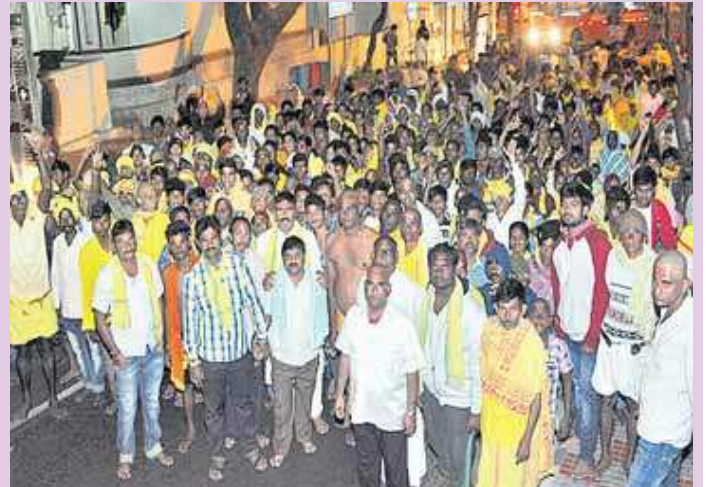
పాదయాత్రతో తిరుమలకు చేరుకున్న రైల్వేకోడూరు నియోజకవర్గం ఓబులవారిపల్లె మండలానికి చెందిన 800 మంది