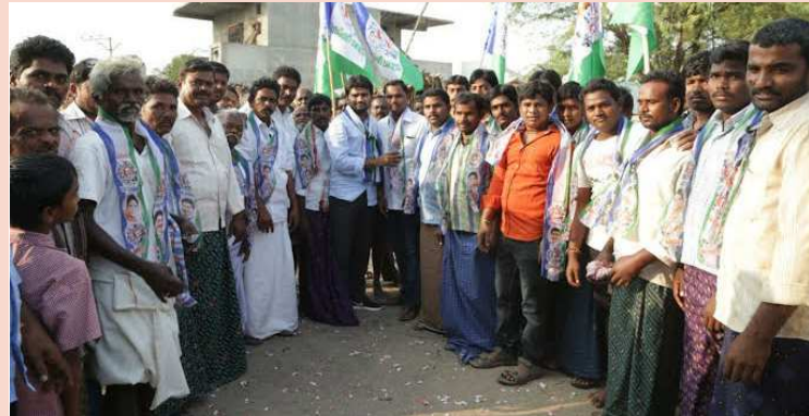
వైయస్ఆర్ సీపీలో చేరిన టీడీపీ నాయకులు